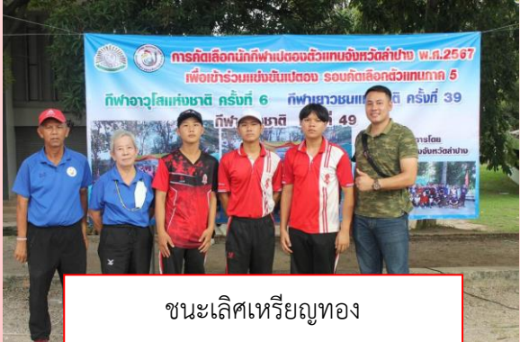
ชนะเลิศเหรียญทอง กีฬาเปตองประเภทคู่ชาย