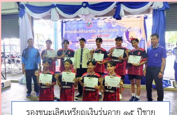
รองชนะเลิศเหรียญเงินรุ่นอายุ ๑๕ ปีชาย กีฬาวอลเลย์บอล