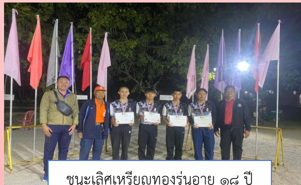
ชนะเลิศเหรียญทองรุ่นอายุ ๑๘ ปี กีฬาเปตองประเภททีมชาย