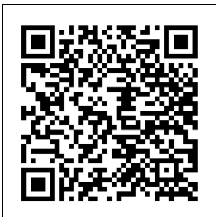
จดหมายข่าวโรงเรียนแจ้ห่มวิทยา ปีการศึกษา ๒๕๖๖