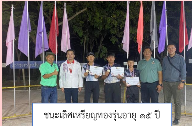
ชนะเลิศเหรียญทองรุ่นอายุ ๑๕ ปี กีฬาเปตองประเภททีมชาย

การแข่งขันกีฬาเยาวชนและประชาชนจังหวัดลำปาง ประจำปี ๒๕๖๖