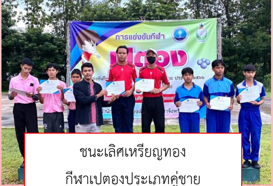
ชนะเลิศเหรียญทอง กีฬาเปตองประเภทคู่ชาย