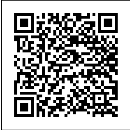
สรุปรงาน ๕ ฝ่าย