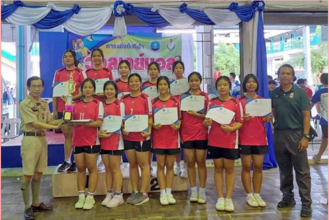
ชนะเลิศเหรียญทอง กีฬาบอลเลย์บอลหญิง รุ่นอายุไม่เกิน ๑๘ ปี