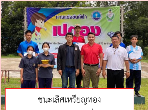
ชนะเลิศเหรียญทอง กีฬาเปตองประเภทเดี่ยวชาย

การแข่งขันกีฬาเยาวชนแห่งชาติ ประจำปี ๒๕๖๖ เพื่อหาตัวแทนจังหวัดลำปาง ไปแข่งต่อระดับภาคที่จังหวัดแม่ฮ่องสอน