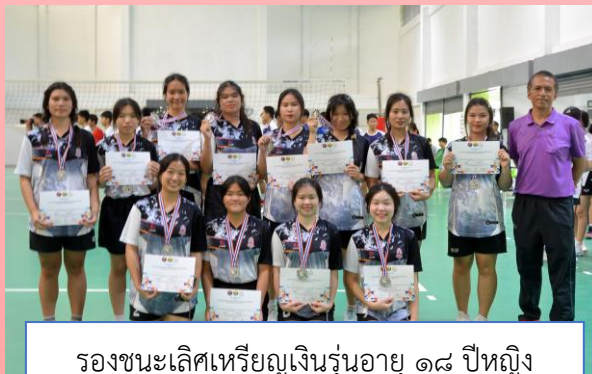
รองชนะเลิศเหรียญเงินรุ่นอายุ ๑๘ ปีหญิง กีฬาวอลเลย์บอล