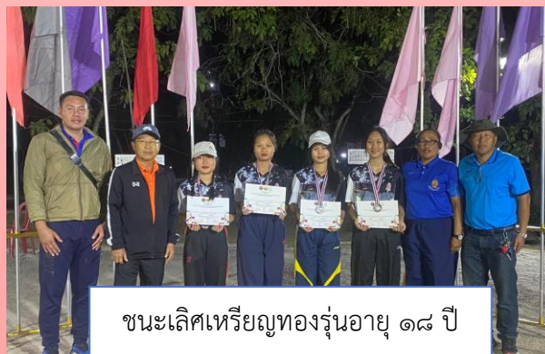
ชนะเลิศเหรียญทองรุ่นอายุ ๑๘ ปี กีฬาเปตองประเภททีมหญิง