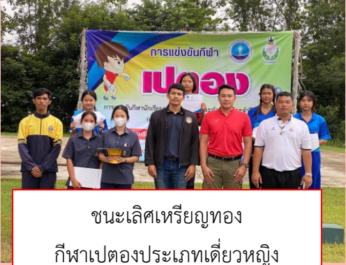
ชนะเลิศเหรียญทอง กีฬาเปตองประเภทเดี่ยวหญิง