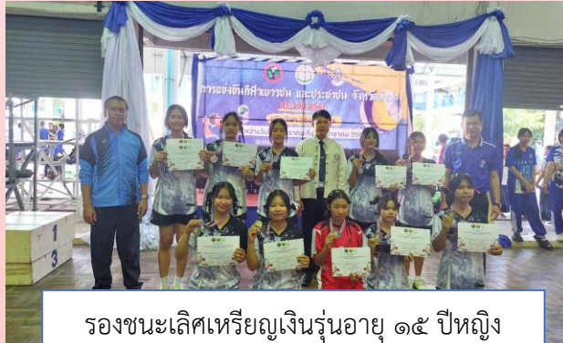
รองชนะเลิศเหรียญเงินรุ่นอายุ ๑๕ ปีหญิง กีฬาวอลเลย์บอล

การแข่งขันกีฬาเยาวชนและประชาชนจังหวัดลำปาง ประจำปี ๒๕๖๖