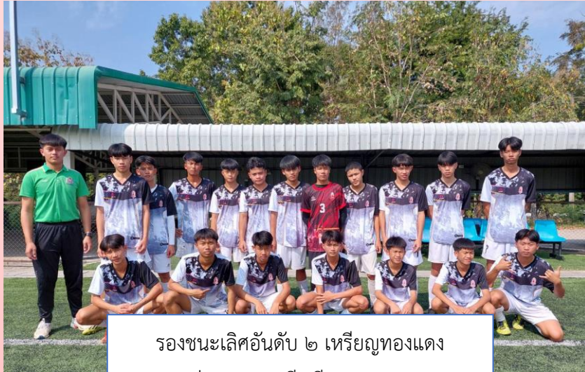
รองชนะเลิศอันดับ ๒ เหรียญทองแดง รุ่นอายุ ๑๕ ปี กีฬาฟุตบอล

การแข่งขันกีฬาเยาวชนและประชาชนจังหวัดลำปาง ประจำปี ๒๕๖๖