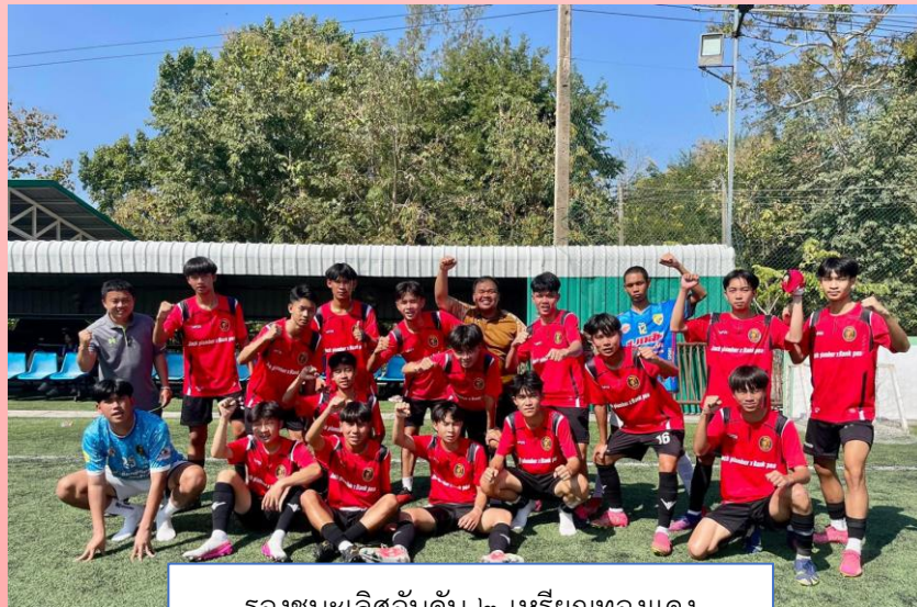
รองชนะเลิศอันดับ ๒ เหรียญทองแดง รุ่นอายุ ๑๘ ปี กีฬาฟุตบอล